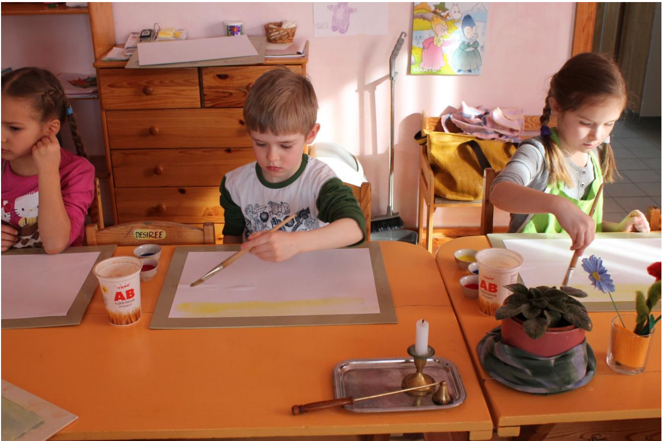
Koolieelikud iseseisvalt maalimas, esmalt kaetakse paberipind kollase värviga