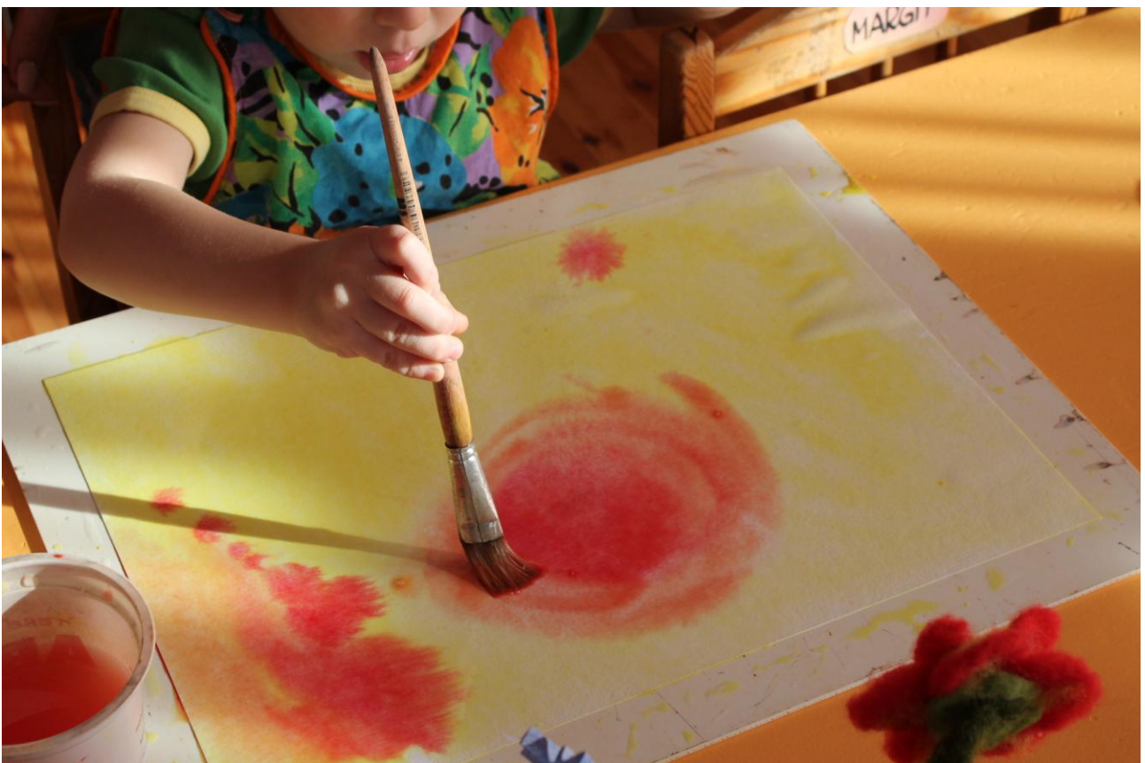
2–3-aastane, punase värvi lisamine