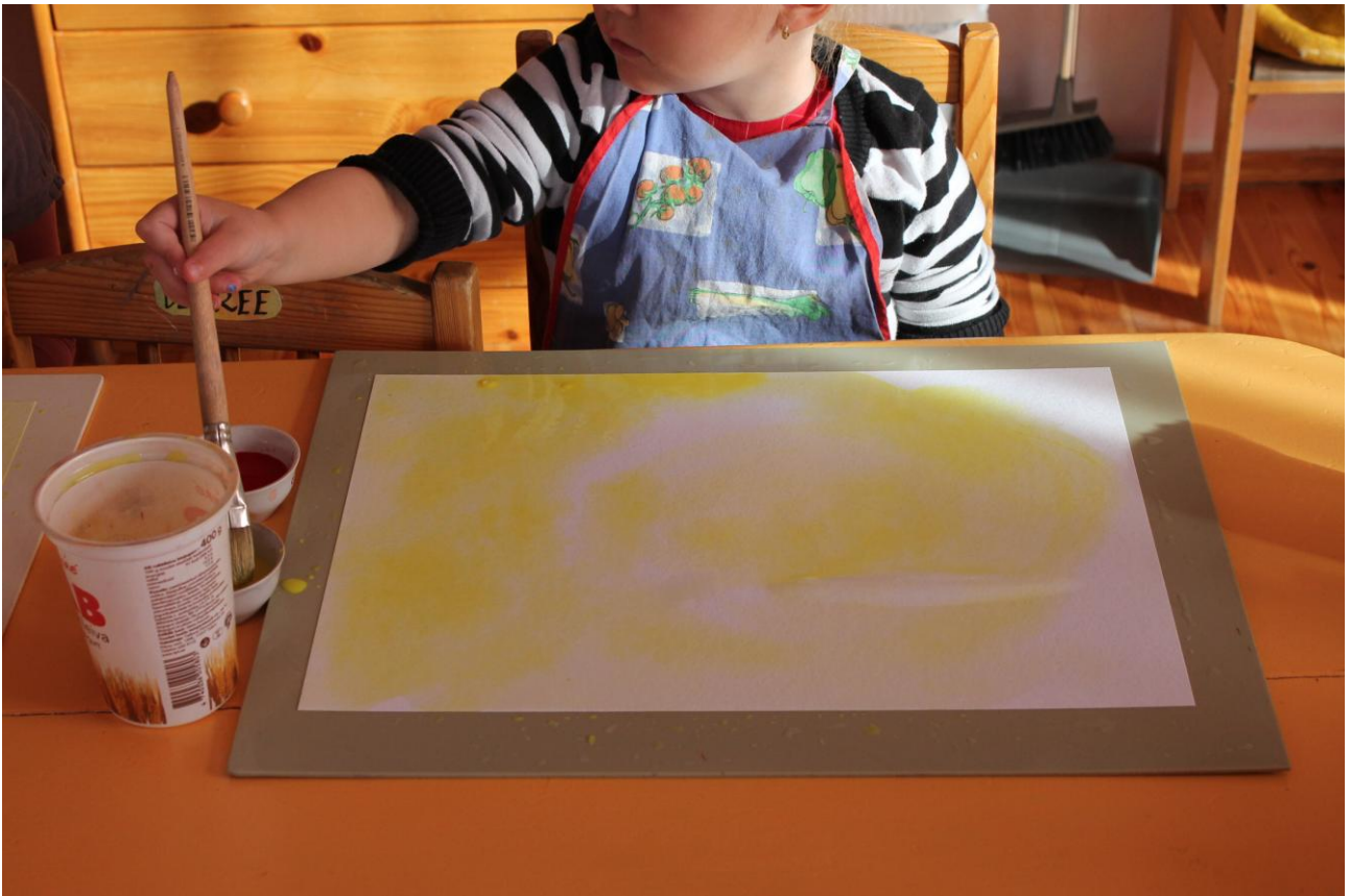
2–3-aastane katab paberi kollase värviga