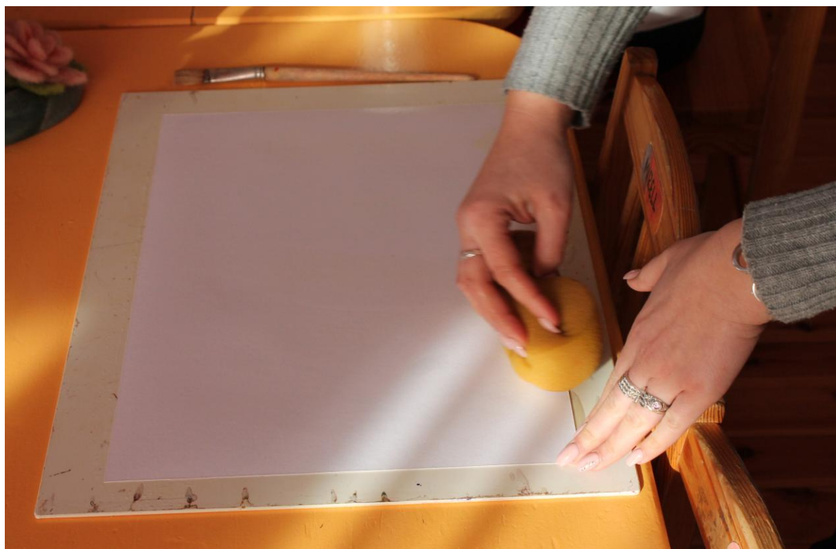
Õpetaja niisutab švammiga maalispaberit