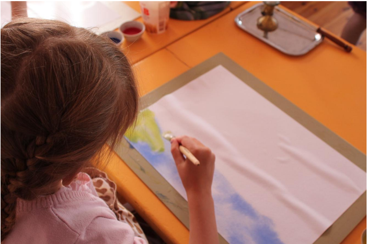
4-5-aastastel on kasutuses ka sinine värv