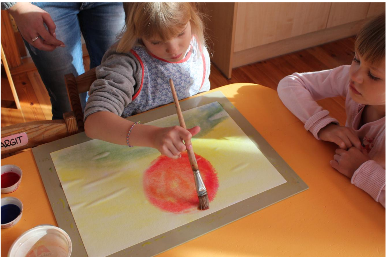
Koolieelikud, lõpuviimistlus päikesele