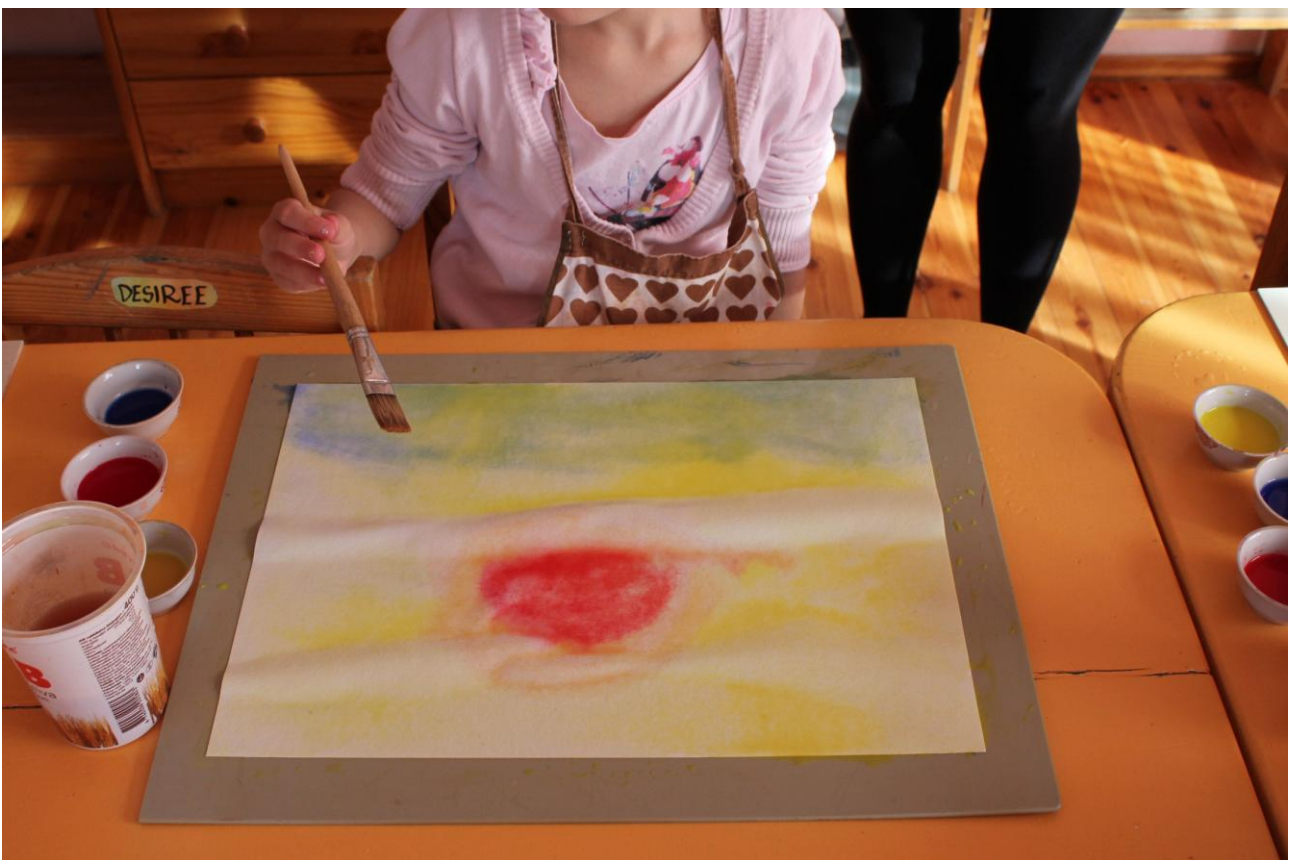
4-5-aastane oma tööd tegemas