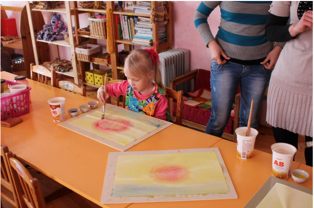
Õpetaja töö on eeskujuks