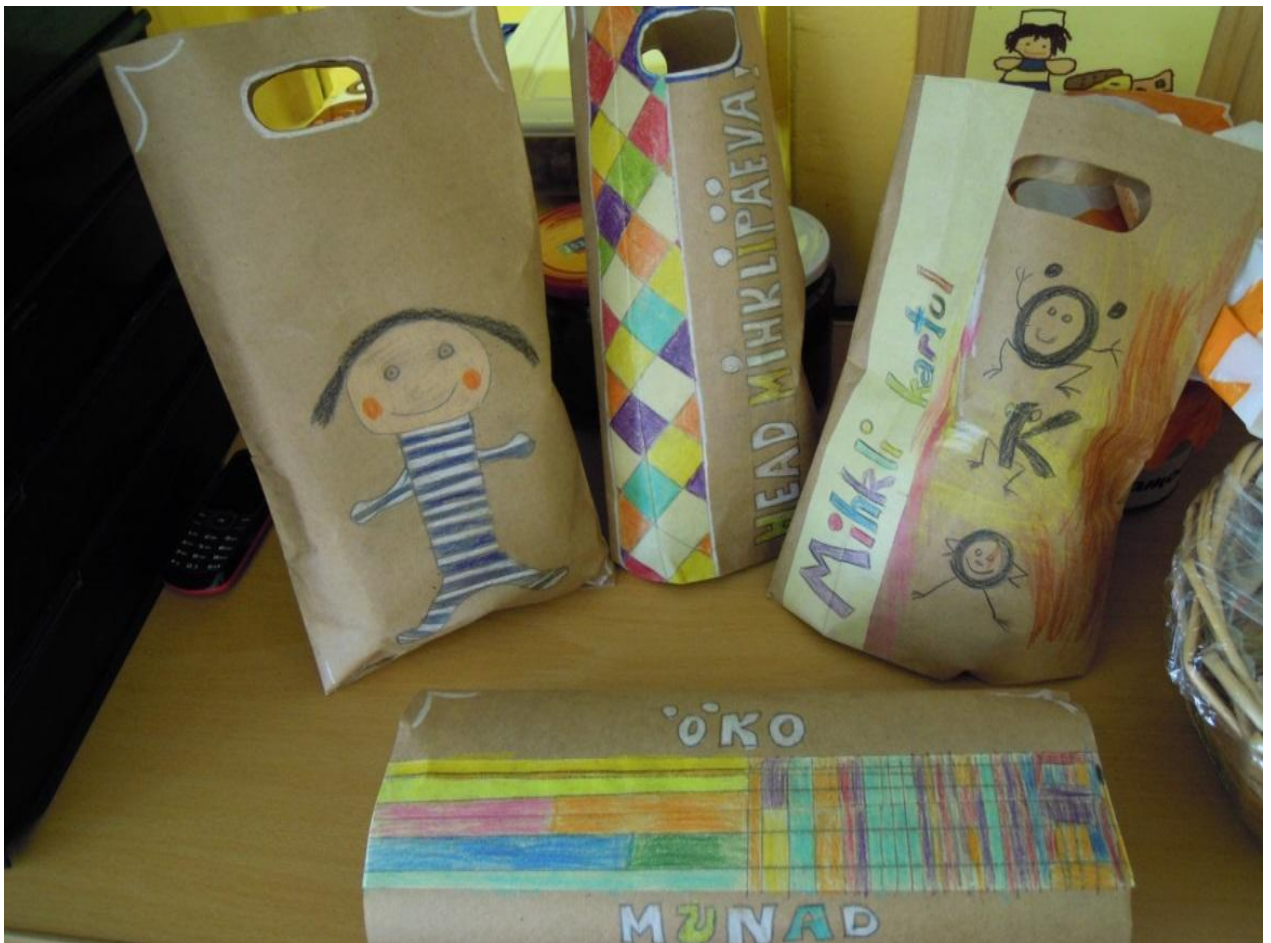
Sipsiku rühma kaup ökolaadale