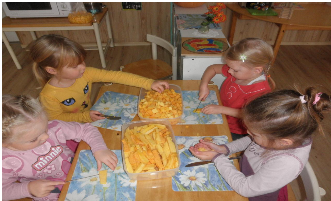
Pääsupesa rühma lapsed ökolaadale kõrvitsasalatit valmistamas (foto autor Tartu Lasteaed Pääsupesa õpetaja Krista Bernhardt)