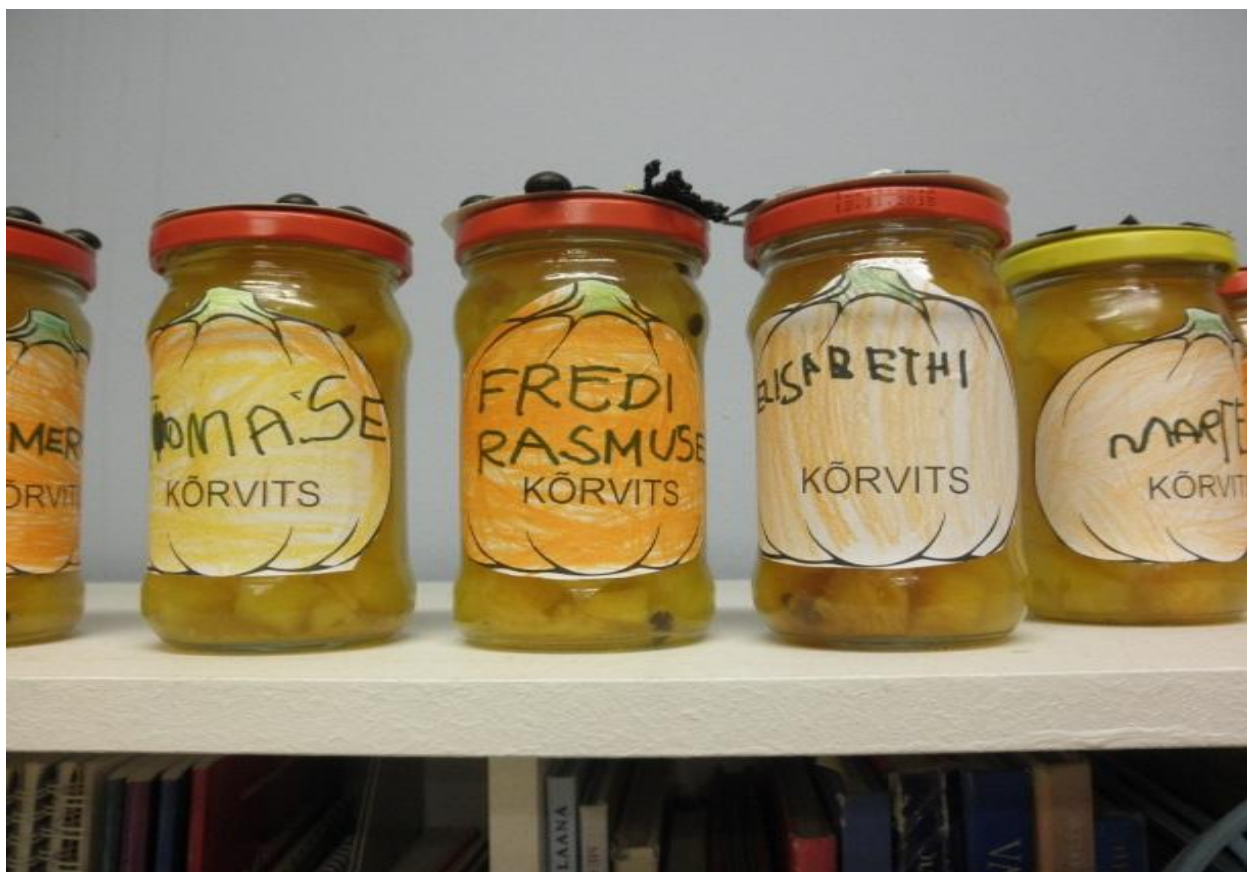
Päsusaba rühma ökolaada laup (foto autor Tartu Lasteaed Pääsupesa õpetaja Krista Bernhardt)