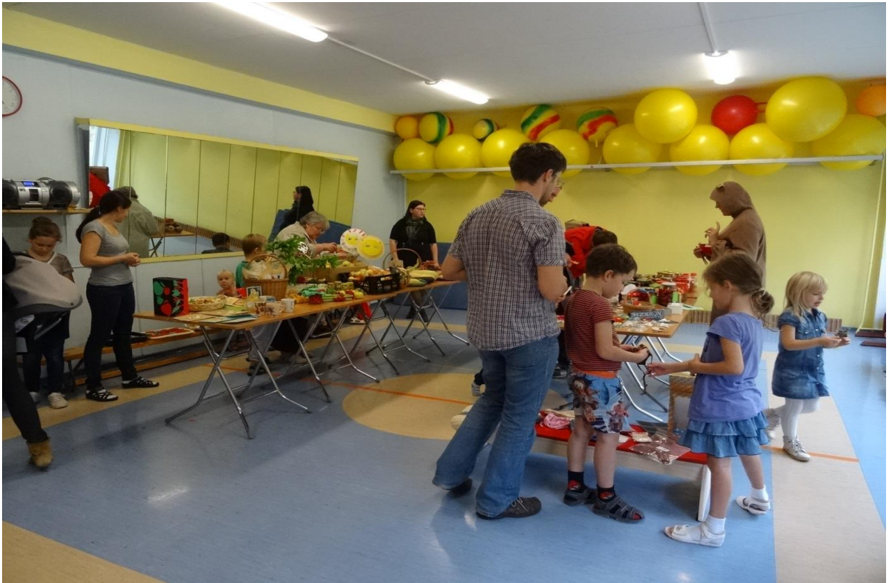
Õkolaat lasteaia võimlas