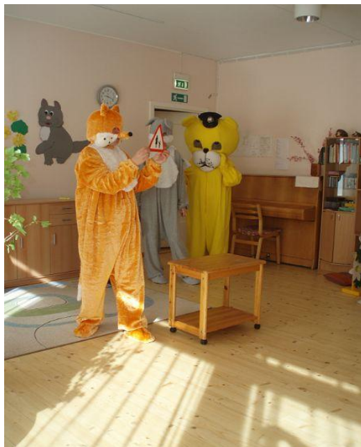
Õpetajate näidend lastele “Hooletus ees, õnnetus taga”