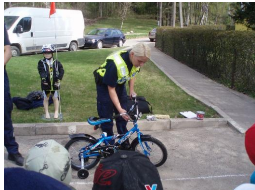
Rattapäev: külas on politsei